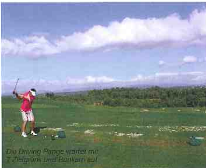
Die Driving Range wartet mit 7 Zielflächen und Banketts auf.