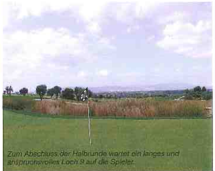
Zum Abschluss der Halbrunde wartet ein langes und anspruchsvolles Loch 9 auf die Spieler.

schaft gepflanzt und werden von Blumenwiesen und Rebstöcken umrahmt. Zahlreiche Seen und natürlich wirkende Bachverläufe, die auch als Bewässerungsquellen dienen, bieten den Spielern weitere Herausforderungen. Die überdurchschnittlich grossen Grüns sind schnell und nicht einfach.