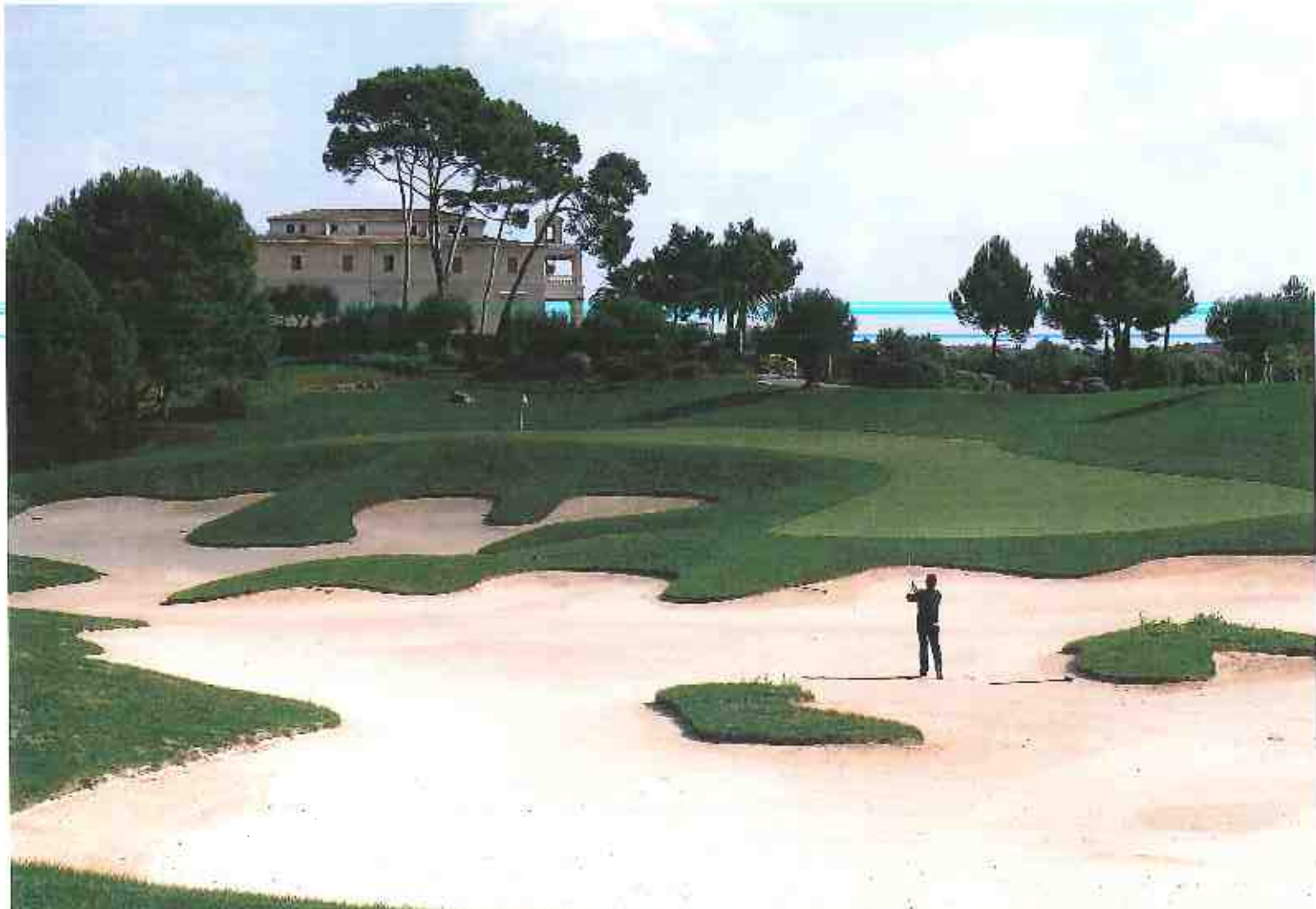
Loch 15, wehe dem, der bei diesem Par 3 im Bunker landet.