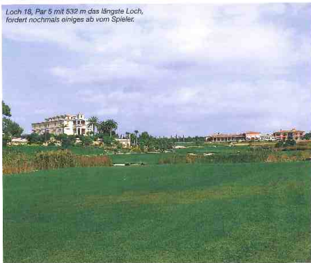
Loch 18, Par 5 mit 532 m das längste Loch, fordert nochmals einiges ab vom Spieler.