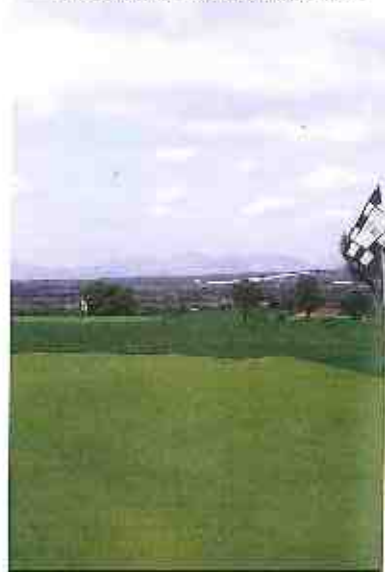
Ein Loch ohne Sandbunker ist Loc

Vor rund zwei Jahren war die Eröffnung des Golfplatzes Son Gual auf Mallorca. Schon damals berichtete man über den von Thomas Himmel entworfenen Golfplatz nur in den Superlativen. Heute zählt Son Gual Golf zu den Elite-Golfplätzen Europas.