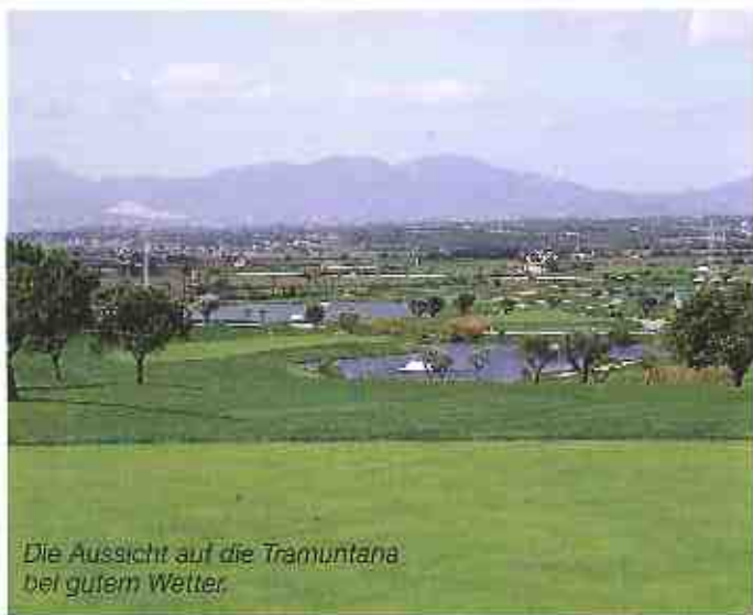
Die Aussicht auf die Tramuntana bei gutem Wetter.

ihre spielerischen Grenzen zeigen, vor allem dann, wenn von den sechs zur Verfügung stehenden Abschlägen der falsche gewählt wird.