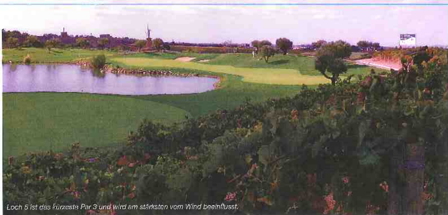
Loch 5 ist das kürzeste Par 3 und wird am stärksten vom Wind beeinflusst.