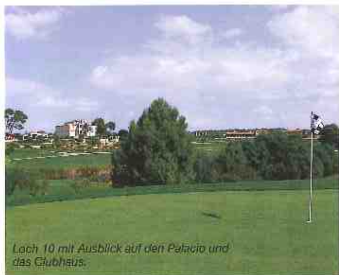
Loch 10 mit Ausblick auf den Palacio und das Clubhaus.