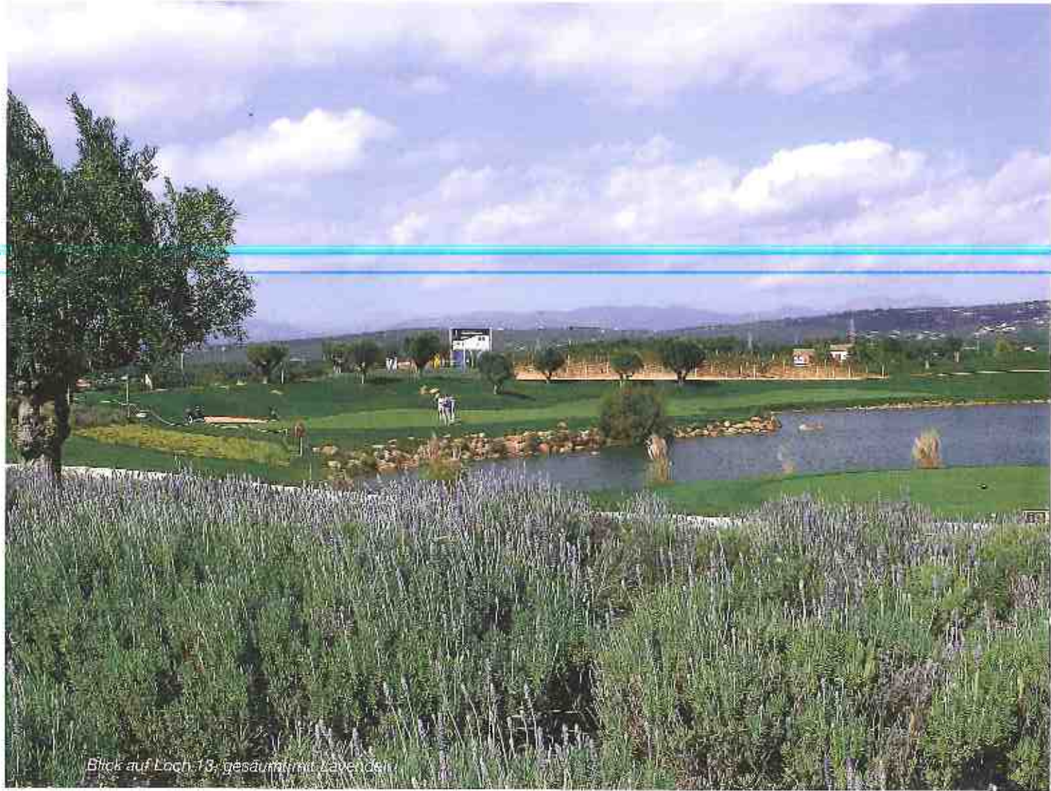
Blick auf Loch 18, gesäumt mit Lavendel.