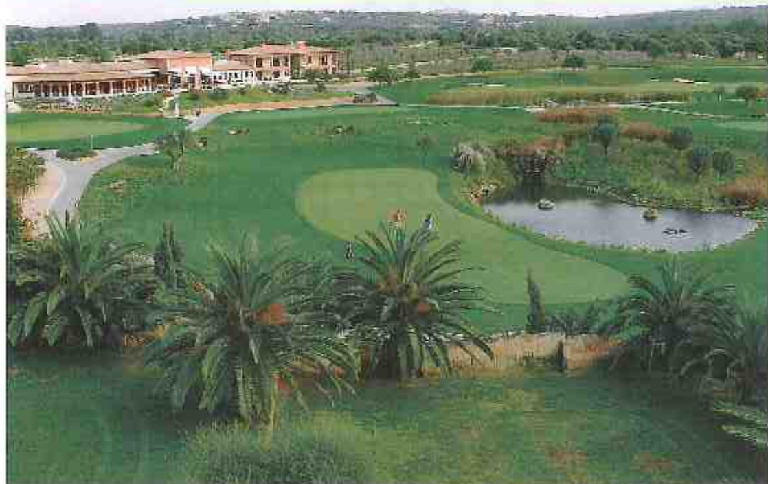
Aussicht vom alten Palacio auf die Grüns 9 und 18 und das Clubhaus.