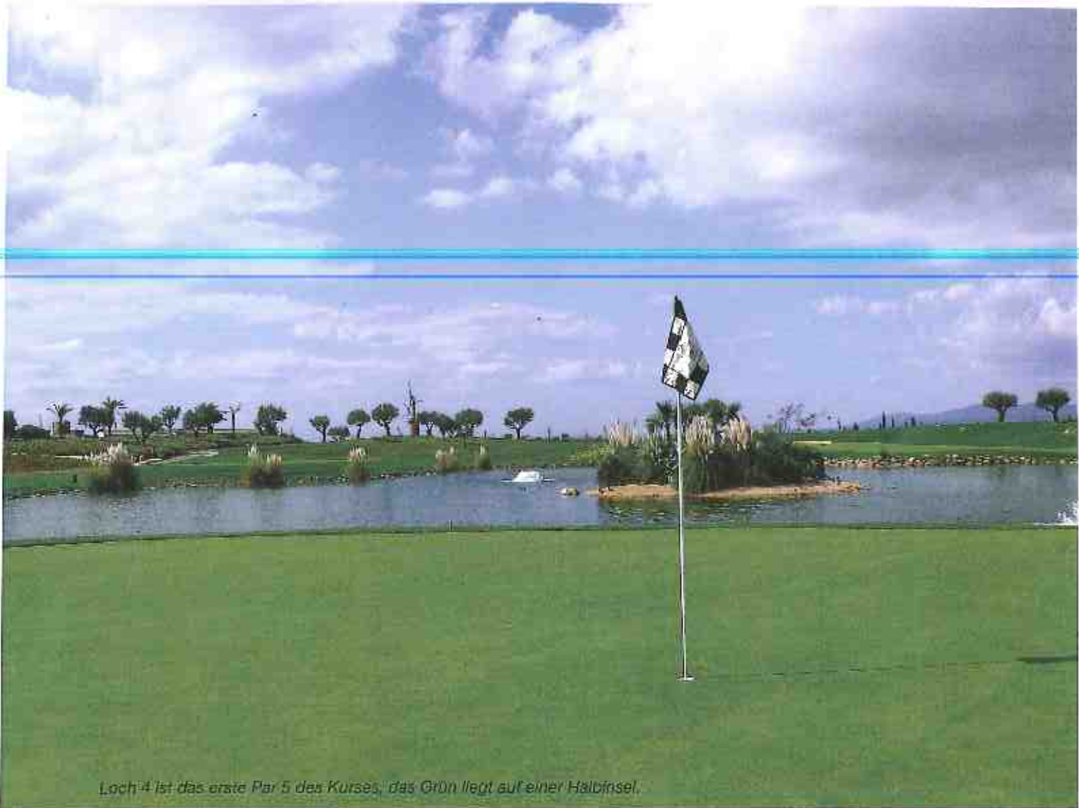
Loch 4 ist das erste Par 5 des Kurses, das Grün liegt auf einer Halbinsel.